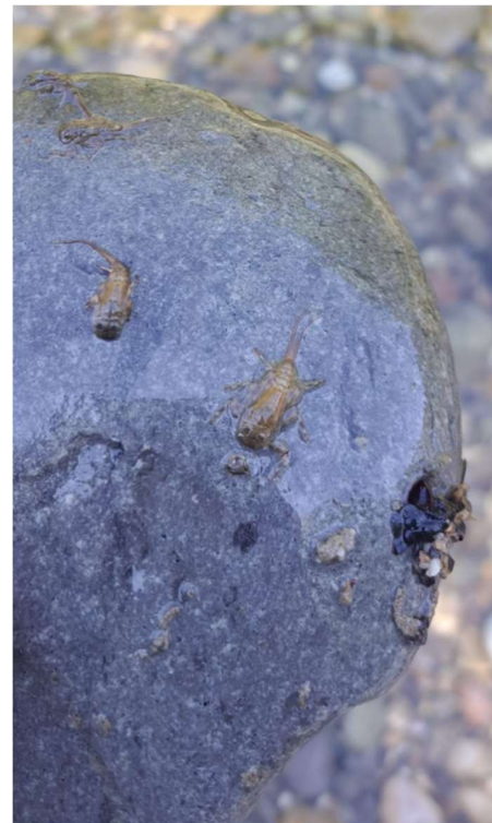
Abbildung 2: Eintagsfliegenlarven Emme