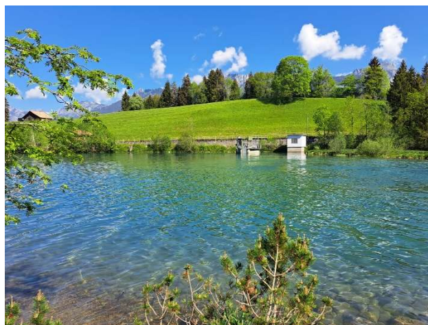
Abbildung 1: Ägelsee Diemtigtal